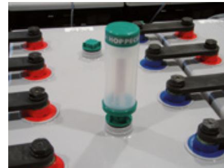
Abbildung 3: Montierter aquagen