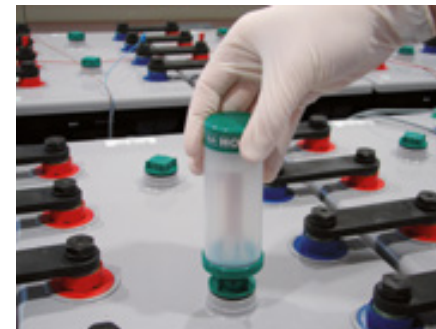
Abbildung 1: Einsetzen des aquagen I

Der aquagen wird in den entsprechend vorbereiteten Bajonettstopfen senkrecht eingesetzt (Abbildung 1), und unter leichten Drehbewegungen bis zum Anschlag in den Bajonettstopfen eingedrückt (Abbildung 2). Der aquagen ist fertig montiert (Abbildung 3).