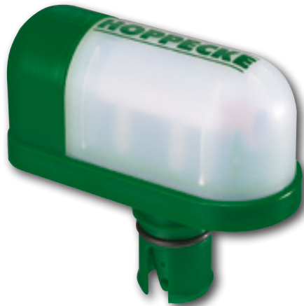
grid | aquagen pro