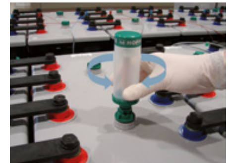
Abbildung 2: Einsetzen des aquagen II