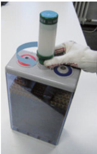
Abbildung 4: Aquagen herauslösen

Um den aquagen von der Batterie zu entfernen, wird der aquagen – zusammen mit seinem Bajonettstopfen – durch Drehen gegen den Uhrzeigersinn gelöst und von der Zelle abgehoben.