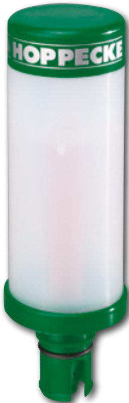
grid | aquagen pro max